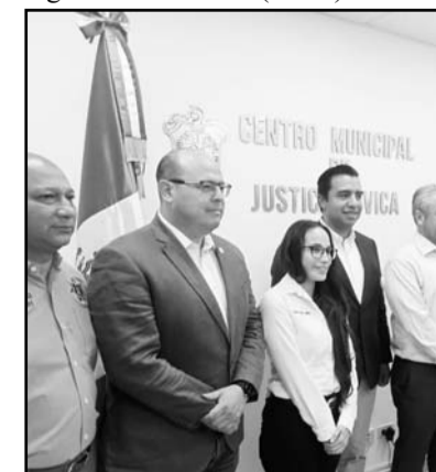
Lo presentó a diputados

daños. Dicho ello los agentes viales de Santa Catarina traerán cámaras de solapa y se evitarán moches y actos de corrupción, pues ya no hay multas sino el transitar hacia un Juez Cívico si cometen violaciones a los reglamentos viales. (AME)