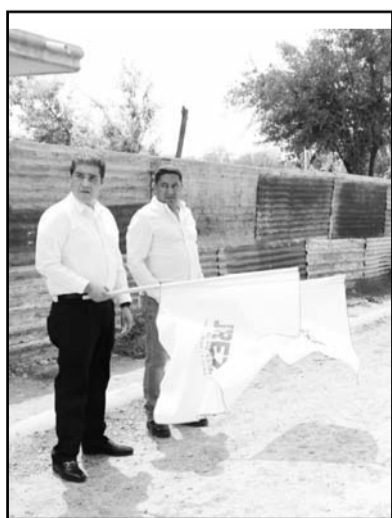
Se dio el banderazo inicial mentación, además de que se equipará la plaza de la colonia”, señaló.

“En este sector existen más calles de terracería, por lo que ya se está proyectando junto con el Secretario de Obras Públicas más trabajos de pavi-