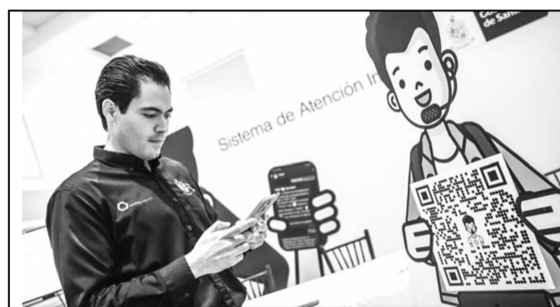
Se atenderán las solicitudes en menos de 48 horas

imiento de caminos rústicos, mantenimiento de luminarias, pintura de camellones, poda, recolección de basura y trabajos u obstrucciones en la vía pública.